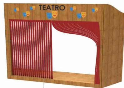
Sipario che si apre

Teatro in legno da esterno dimensioni 300x60x180 ca